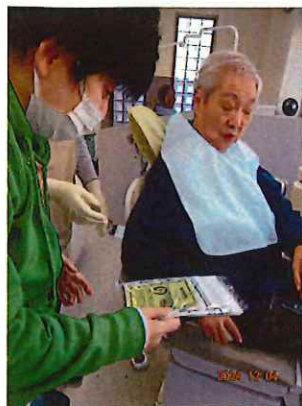
於:大島歯科さんの診察室!!