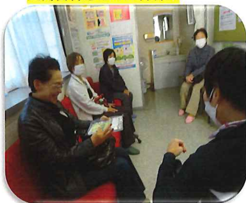
大島歯科さんの待合室